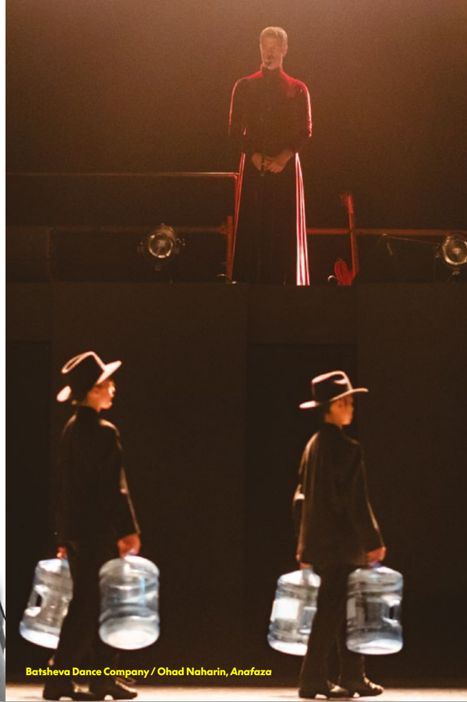
Batsheva Dance Company / Ohad Naharin, Anafaza