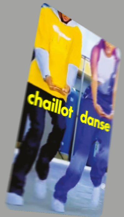
Pass Chaillot Groupe