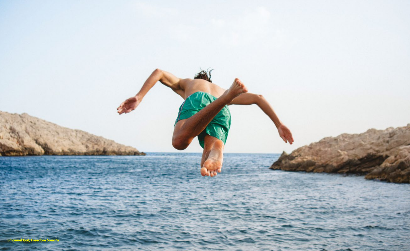
Emanuel Gat, Freedom Sonata