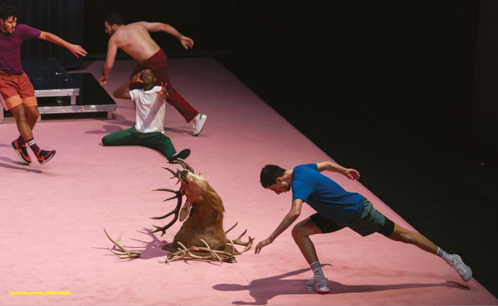
Olivia Grandville, Débandade