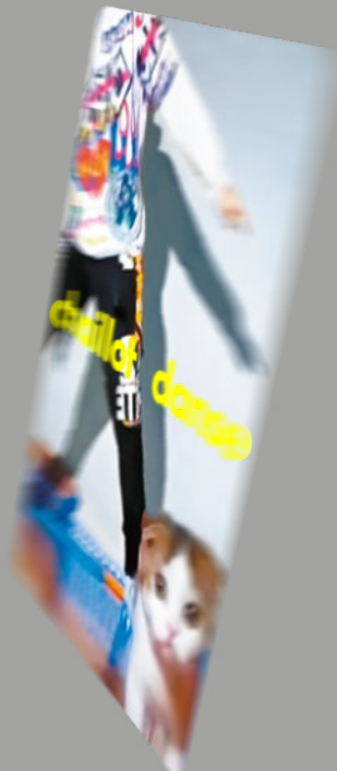
Pass Chaillot Jeune