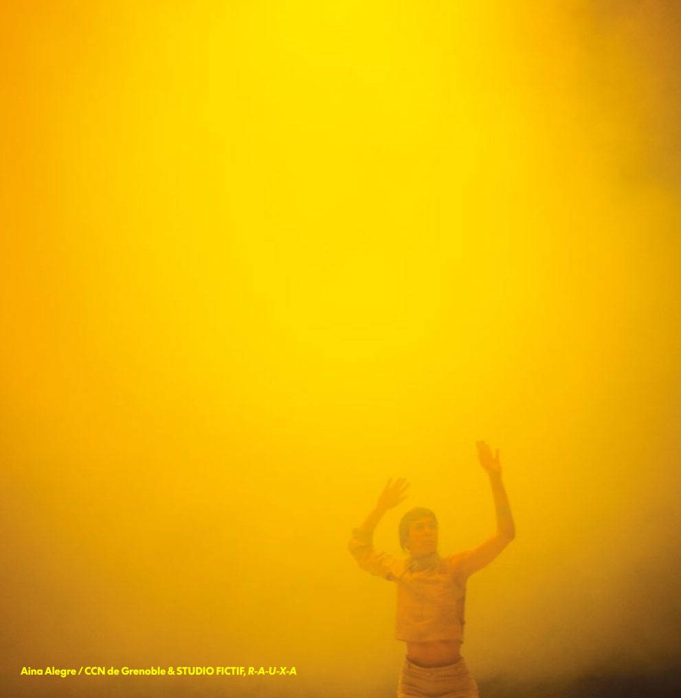
Aina Alegre / CCN de Grenoble & STUDIO FICTIF, R-A-U-X-A