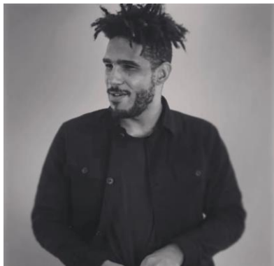
Swany Landau Création audiovisuelle