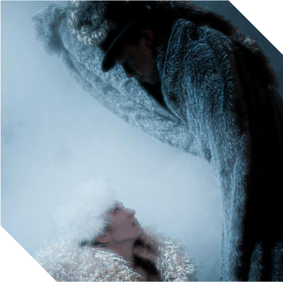
Le Loup et l'Agneau