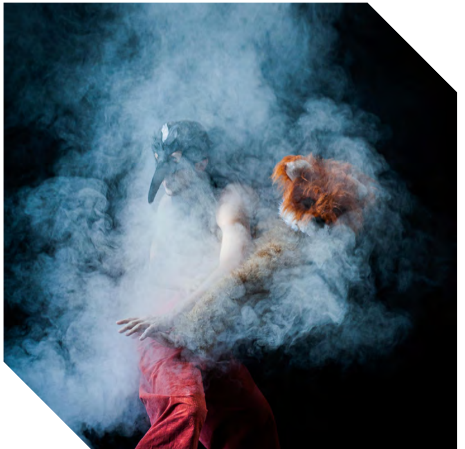
Le Corbeau et le Renard ©Chaillot – Théâtre national de la Danse / Benjamin Mengelle