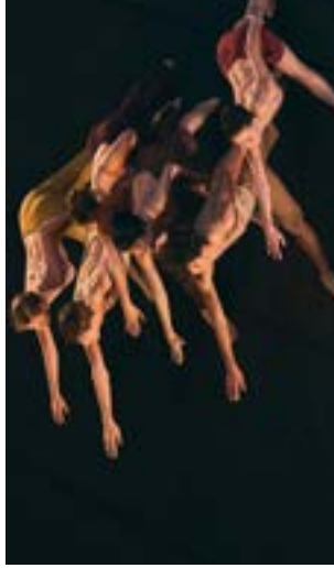
My Way de Rubén Julliard

Production: Conservatoire National Supérieur de Musique et de Danse (CNSMD) de Lyon.